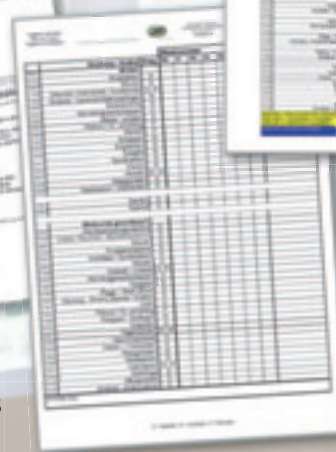
CONTROLEBLAD HYGIENE WERKPLAN

Alles wordt voor u overzichtelijk en controleerbaar. Zowel op het gebied van reiniging en desinfectie als op economisch vlak.