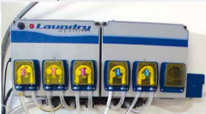
ZEP SMART LAUNDRY 5

ZEP SMART LAUNDRY 3 / ZEP SMART LAUNDRY 5 Dosierungssystem für Waschmaschinen mit 3 oder 5 Pumpen: